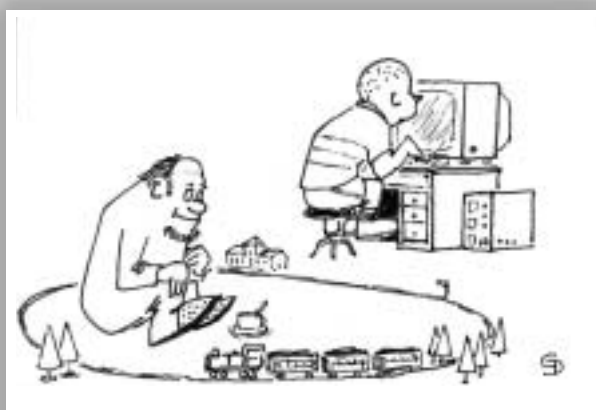
Kresba Dušan Grombiřk