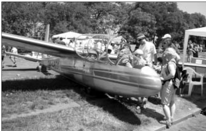
Kdo si hraje, nezlobí...

V únoru Senát zamítl návrh nového trestního zákona, jehož součástí bylo například i snížení hranice trestní odpovědnosti z 15 na 14 let. K výhradám senátorů patřilo podle Pavla Janaty (KDU-ČSL) mj. i to, že hranici trestněprávní odpovědnosti na 14 let zakomponovali do zákona až poslanci, což zhoršilo původní verzi kodexu. Nový trestní zákoník, vetovaný Senátem, pak v březnu smetla ze stolu Poslanecká sněmovna (a to kvůli absenci paragrafu o tunelování). K zákonu se tak politici vrátí až po volbách.