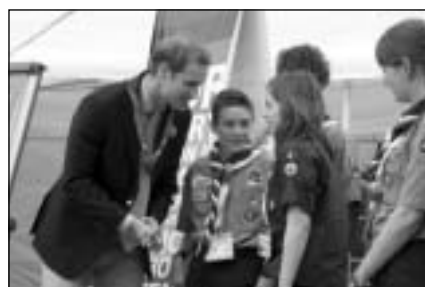
Britský princ William mezi skauty na Jamboree 2007 v Essexu