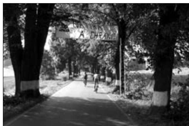
Vidíte ten rozdíl? Natřeno – ochráněno.