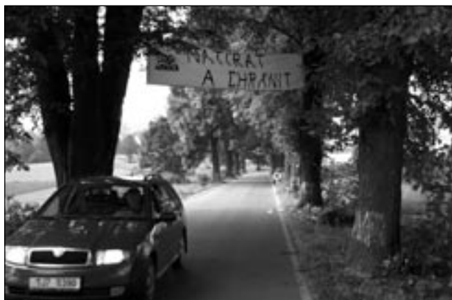
Pohled první: Na obnovení nátěru se jaksí pozapomnělo...

Třešť, 23. září 2009 Celkem bylo potřeba natřít více než sto stromů. Před natíráním je třeba odstranit výhonky a očistit kmen stromu. Na natírání se podílelo asi 15 dobrovolníků a pracovníků Arnika. Řidiči osobních i nákladních aut stejně jako cyklisti dostali letáček s informacemi, co a proč se v aleji děje, a k tomu jako dárek leták o alejích Vysočiny.