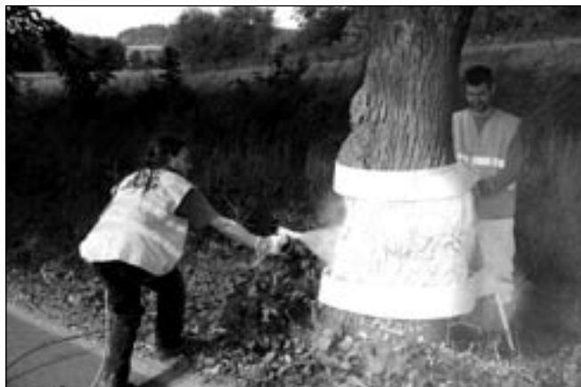
Bílý smí být jen ohraničený pruh. A natěrač.