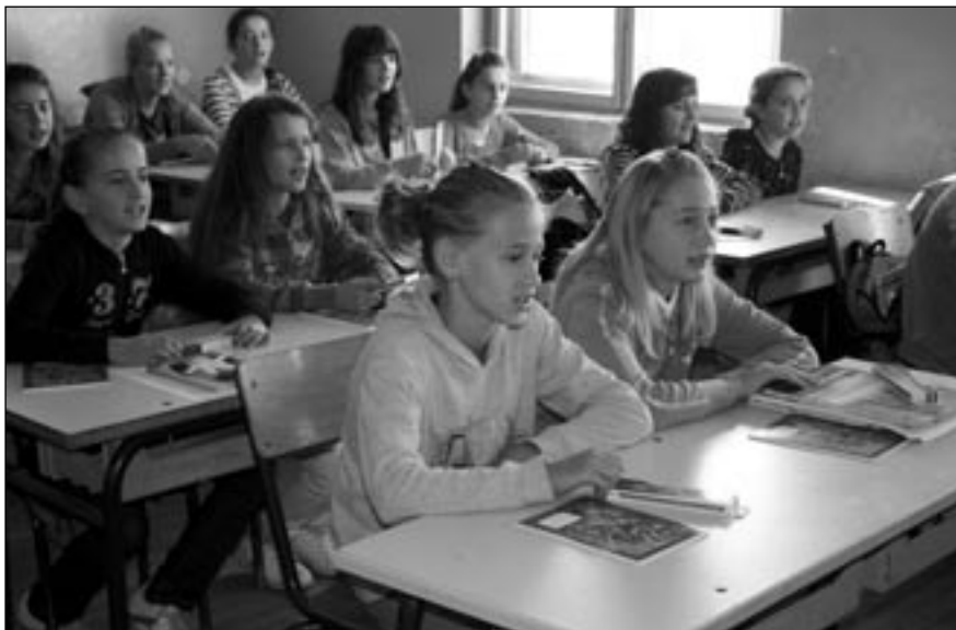
Šajkovacké děti dostaly sešity a psací potřeby

Vůz vojenské policie trpělivě proráží kolonami aut metr za metrem cestu našemu autobusu na trase z přístižského letiště směrem na Podujevo. Proud vozidel před námi, jiný proti nám. V obou kolonách čekají na svou řídicí příležitost šoféři automobilů nejrůznější provenience – včetně nových mercedesů – ale nechybí tu ani oslící zapřažení do nákladů dřeva či sklizené kukuřice. Když to nejde jinak, vojenský policista co chvíli vyskočí ze služebního auta, běží před ním a potřebnou průrvu v husté dopravní zácpě vyjednává s laxnějšími řidiči do jejich stažených okýnek tváří v tvář. Českou poznávací značku kolem projíždějící škodovky si vojáci rutinně zapsali: působí tu přece jen poněkud exoticky – vážně má potřebné „papíry“ v pořádku...?