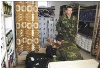
Čeští vojáci KFOR pomáhají s humanitární pomocí v Luzane

Během tří dnů, po které jsme byli jejich civilními hosty, nás vojáci 15. českého kontingentu KFOR brali na své cílené výjezdy z šajkovacké základny do okolí s sebou. Všechny tyto zdánlivě drobné „mise“, jichž jsme tak byli svědky, měly vysloveně humanitární charakter. Jako příklad snad jedna postać.