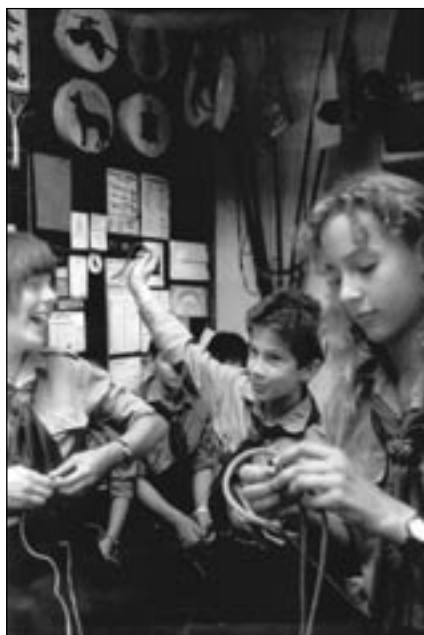
V klubovně oddílu Ze-Hnje-She-Kha, ve Velešlavínové ulici, 1990