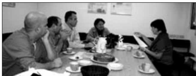
Jednání o budoucí spolupráci a zamýšleném projektu pro mládež

Na pozvání našich izraelských partnerů jsme tedy oplátili tentokrát třídenní návštěvu my, s obdobně strukturovaným studijně pracovním programem, který byl připraven částečně na míru. Přípravná a plánovací návštěva projektu byla spojena s obecnějším poznáním střešní organizace hnutí mládeže v Izraeli, fungováním celého sektoru a společensko-historických souvislostí. Všechny tyto prvky byly dokonale naplněny a dozvěděli jsme se toho snad víc, než se dá za takto krátkou dobu předpokládat. Informace využijeme pro přípravu projektu, a hlavně jeho účastníků, týmu mladých lidí, kteří se na svůj „průkopnický“ čin na poli mezinárodní spolupráce v příštím roce již těší. Rádi bychom se o některé z nich podělili tímto článkem se čtenáři.