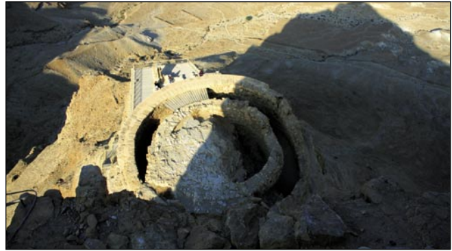
Část pouštní pevnosti Masada – její poloha na skalním masivu ji činila téměř nedobytnou

Izrael je malá země a rozmanitost krajiny jsme poznali tehdy, když jsme pouhou hodinku jízdy po dálnici uviděli Judskou poušť. Naše cesta tam měla dva cíle. Ten první nám měl ukázat něco z literární historie. Kumránské svitky od Mrtvého moře, to je pojem pro celý svět. Pro Izraelce má hodnotu v tom, že se jedná o nejstarší písemné texty v hebrejštině. Kontinuitu tradice vzdělanosti ukazuje to, že písmo použité na sedm metrů dlouhých svitcích dokáže přečíst ještě dnes každý školák. Archeologické a písemné pozůstatky místní náboženské skupiny mají také velkou provázanost s učením Ježíše. Senzační objev prvních svitků vyvolal některé závěry, že biblické texty se musí „přepsat“. Nález mnoha dalších pak trošku zklidnil tento převrat.