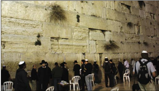
Jeruzalém – Zed' nářků

Yad Vashem má výstavní koncepci zacílenou tak, že z masy šesti miliónů obětí vytahuje zpět na světlo individuální příběhy. Jedním z těch, co „měli zmizet“, je např. pražský kluk ze Žižkova, který v terezinském ghettu psal básničky o tom, jak se mu stýská po Praze. Kromě toho měl výtvarný talent a kdo ví, co by světu přinesl jako dospělý muž, kdyby jeho život neskončil v Osvětlení dřív, než stihl dospět. Expozice také osvětluje úlohu hnutí mládeže v době, kdy vznikla ghetta, oficiální vůdci židovské komunity byli odstraněni a dosazena správa jmenovaná okupanty. Mladí lidé, mezi nimi i ženy, vyvíjeli tajně informační činnost a snažili se rozkrýt pravdivý záměr „Třetí říše“ se řešením „židovské otázky“. Byli ojedinele předvídaví, jaká může být další fáze, a pokoušeli se v některých případech vést lidi jiným směrem, než byla oficiální linie.