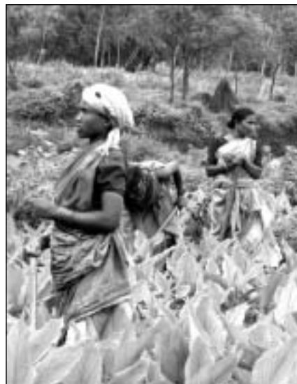
práce na poli

A tak je výsledek našeho snažení jenom shrnutí možných metod, návrh budoucnosti projektu, návrh, jakým způsobem má být šéf organizace informován o průběhu projektu – protože absence kontroly je příčinou mnoha problémů, předpoklady certifikované produkce. Projekt začal pár měsíců před naším příjezdem a nic se do té doby neudálo. V březnu je nahlášená kontrola vládou, a tak je pravděpodobně, že bude projekt