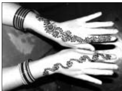
ruce ozdobené henou

A nebyla třeba trochu chyba i v Tobě? Možná to šlo nějakým způsobem předvídat, třeba si ještě víc před odjezdem nastudovat jejich zvyky a tradice... Proč Tě toho neuchránil alespoň ten kolega?