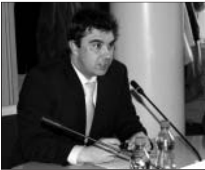
Náměstek ministra školství Jan Kocourek

Plzeň, Rychnov nad Kněžnou, Uherské Hradiště, Tábor, Liberec, Děčín, Zlín... Zástupci a zástupkyně 28 českých a moravských měst, která se zhruba za měsíc stanou kulisami pro jubilejní desátý ročník Bambiriády, se 21. dubna 2008 sjeli od Prahy. Cílem jejich cesty bylo Ministerstvo školství, mládeže a tělovýchovy (MŠMT), kde na tiskové konferenci stručně vylicili, jak má známá akce v jejich městě vypadat a co všechno pro návštěvníky Bambiriády tamní pořadatelské týmy chystají.