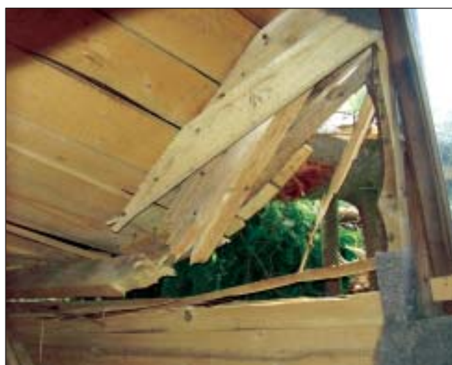
ČTU, T. O. Vosí údolí, LDT Strážná: Při vichřici spadly statné stromy na čtyři chatky a poškodily je. Byly poškozeny plechové střechy chatek, nosné konstrukce, střešní trámy.

Junácké středisko Skály Choceň: Pád stromu poškodil oplocení studny, došlo k destrukci ocelových nosníků a dřevěné výplně; poškozen byl i betonový kryt studny.