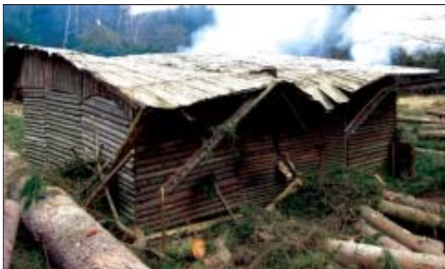
ČTU - TK Zlatáci, Zaječov: Vichřice Emma v okolí tábora vyvrátila cca 200 stromů a z toho asi deset spadlo na táborovou kuchyni. Škody jsou takového rozsahu, že stavba nové kuchyně je nezbytná.