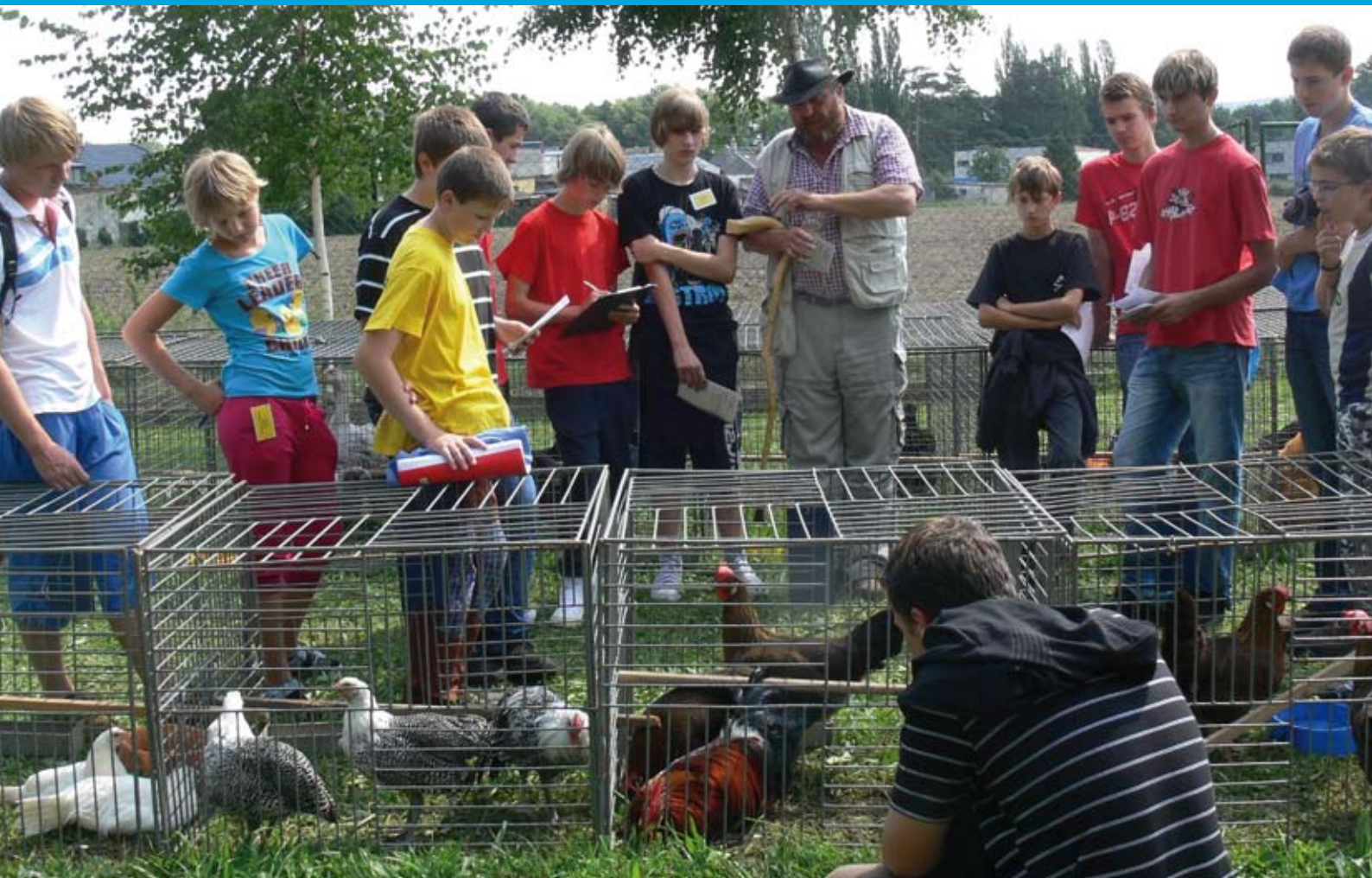
Mladí chovatelé Česká asociace studentů psychologie