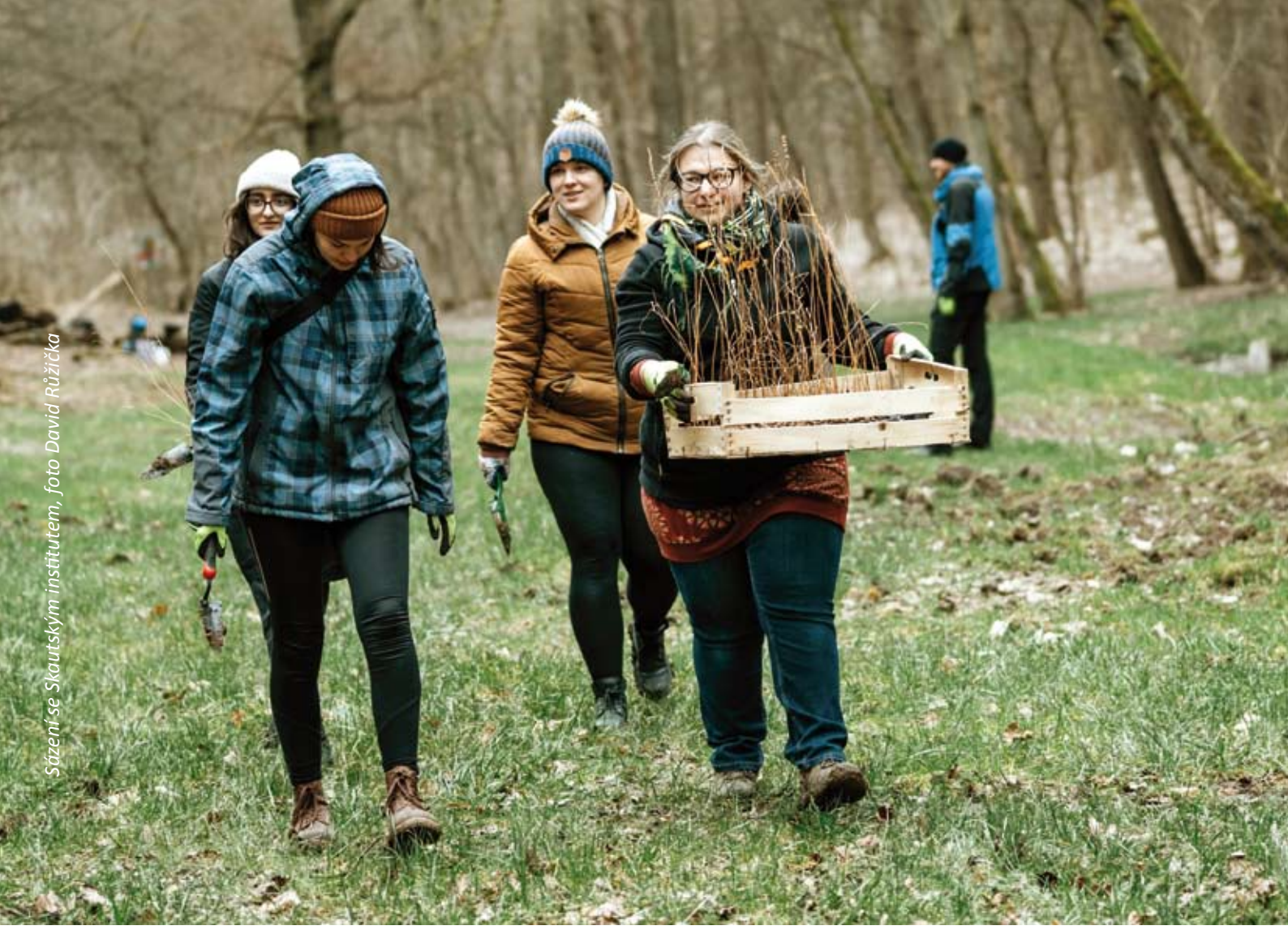
Sázení se Skautským institutem