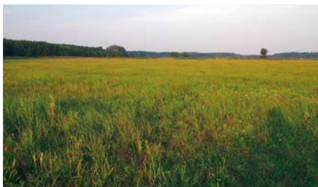
Lokalita Vlčí hrdlo, vykoupená v rámci kampaně Místo pro přírodu

Český svaz ochránců přírody, Jan Moravec Bradáčovské mokřady