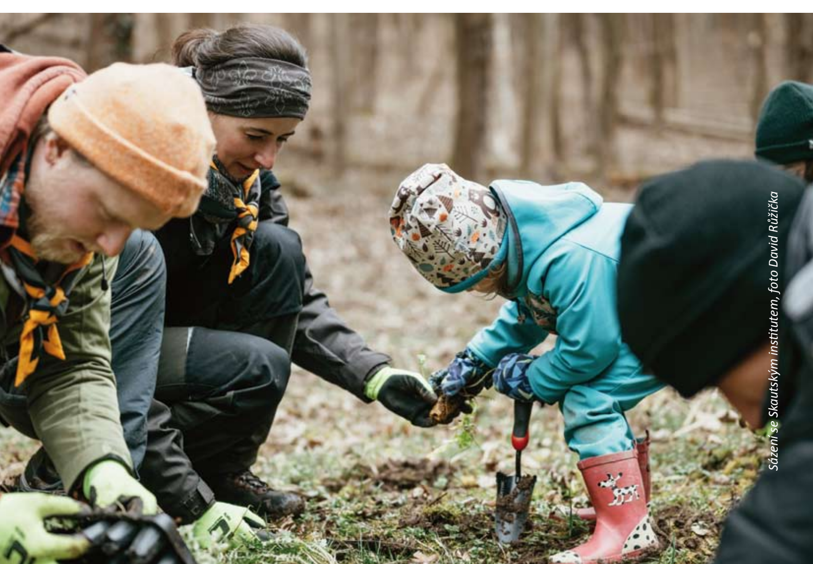
Sázení se Skautským institutem