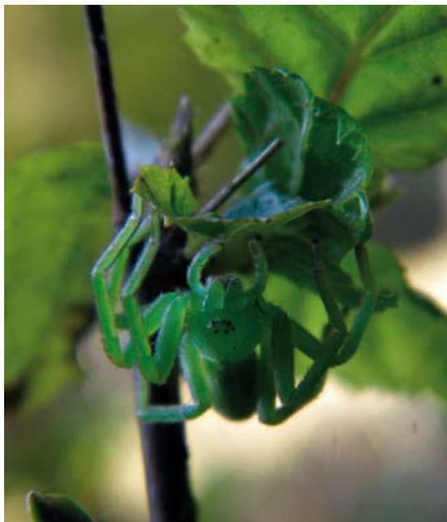
Maloočka smaragdovaná, lokalita Ščůrnica