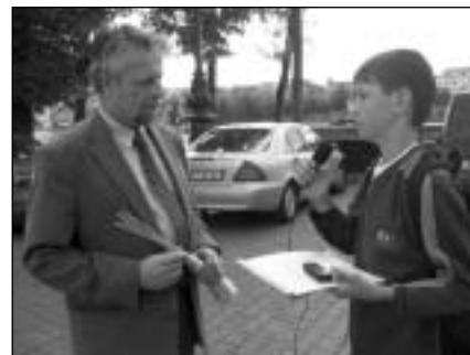
* Susan Rose-Ackerman: Corruption and Government. Causes, consequences and reform , Cambridge University Press, Cambridge - New York - Melbourne 1999

ptal se Jiří Zajíc