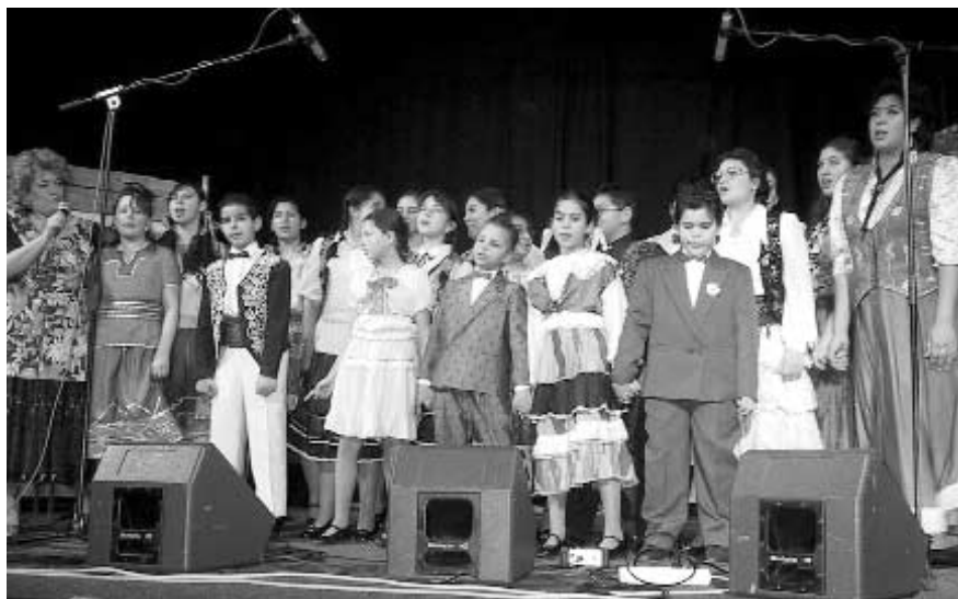
Ilustrační foto – Romský dětský soubor Čhavorikani Luma

Vývoj v příštích 10 letech v tom, co nazýváme problémem soužití, nebude určitě příliš povzbudivý. Všichni asi cítíme mírný pokrok. Žádný prudký zlom nenastane. To ani nelze očekávat. Jde však o to, aby všechny excesy intolerance, rasismu a jen obyčejného primitivismu (viz Knížák) byly odsuzovány ve společnosti jednoznačně politiky, umělci, občany a aby takové projevy se považovaly za něco neslušného a nepatřičného. Stačí se podívat na naše politiky třeba do poslanecké sněmovny, nebo na akce některých našich ministrů a hned vidíme, kde se asi nacházíme. A to má být špička. Dokud takové projevy projdou, aniž by je