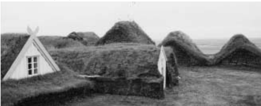
Původní domy islandských obyvatel

Dnes tedy můžeme sestoupit až 204 metrů hluboko, abychom spatřili místo, kudy proudila žhavá láva k povrchu.