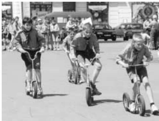
Na Západočeském jamboree se mimo jiné závodí i na koloběžkách

Kluci z oddílu jednou čistili ve městě chodníky od vyrůstající trávy. Šel okolo jakýsi manželský pár a ta paní povídala manželovi: „Podívej, to je hrůza, dřív takovou práci dělali cikáni a dneska to musejí dělat děti.“ Jeden z kluků si to nenechal libit a povídá: „Milá paní, my to neděláme z donucení, ale dobrovolně a zadarmo, protože jsme skauti a chceme, aby naše město bylo hezčí.“ Penny, Klatovy