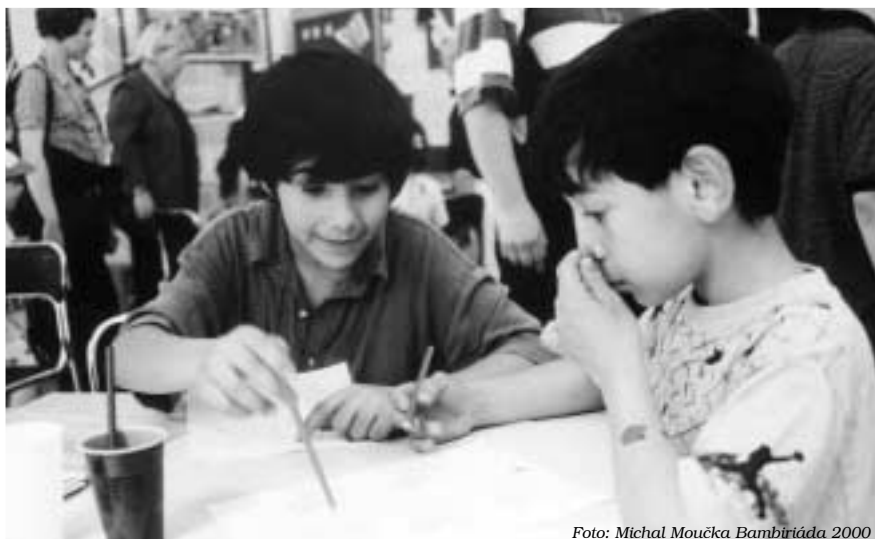
Bambiriáda 2000