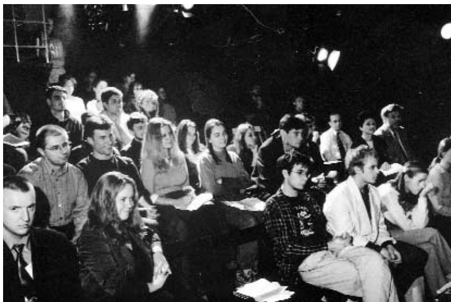
Snímky na straně 3 a 4 jsou ze setkání mladých zástupců dětských sdružení s Petrem Pithartem v divadle Rubin 4. 4. 2002

Spolky našeho typu jsou financovány státními dotacemi, a to nejméně ze 70% svých potřeb. Peníze nejsou nárokovatelné, vymáhat je nemůžeme, i když jsou určeny na nepostradatelnou službu vlasti, totiž práci s dětmi. Je to tak dobře? Nás to sice udržuje v takovém „životabudičském“ napětí, ale na druhou stranu – děláme to, co stát – při vši úctě –