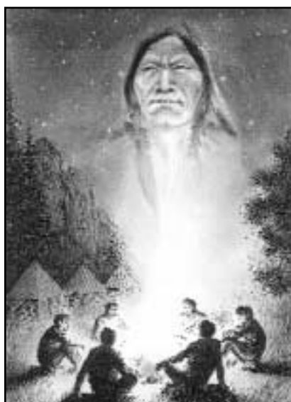
Ilustrace Jiří Petráček